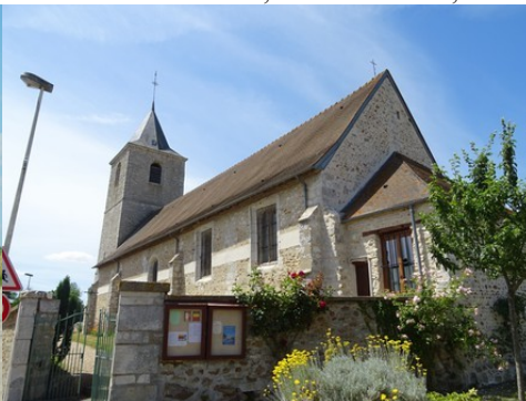
L'église de Douains