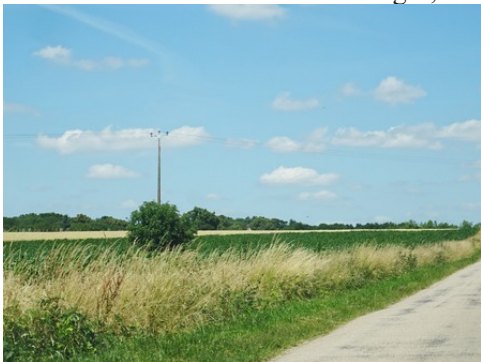
Les champs alentours

Les avis seront cohérents avec ceux émis ces dernières années, à savoir : pas de maisons à volume compliqué (type V, W, Y, ou Z), pentes à 45° pour les volumes principaux, ardoise ou tuile plate de teinte brun vieilli, à 20u/m 2 , avec un débord de toiture de 20cm, enduit de teinte beige clair avec modénatures (au choix : chaînages, encadrement de fenêtres, soubassement, colombage...). *Voir les autres fiches.