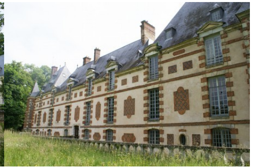
La façade ouest (vue rapprochée)