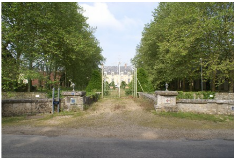
Le château vu du portail d'entrée