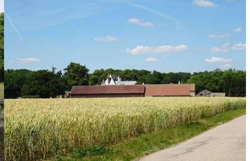
Le château vu de la route de Douains

Pour la zone en rose foncé dans le périmètre de 500m