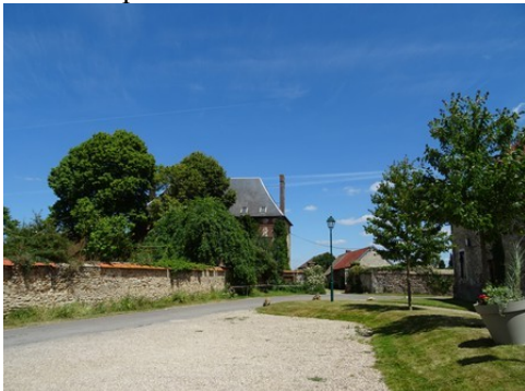
Quelques maisons dans Douains