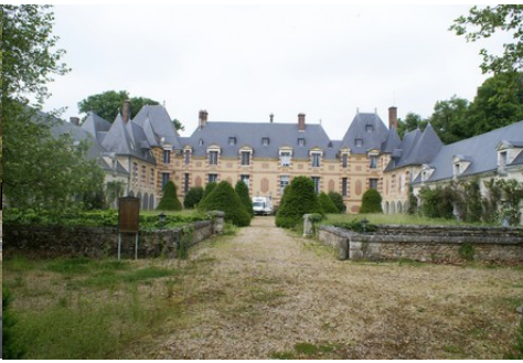
Le château et la cours d'honneur