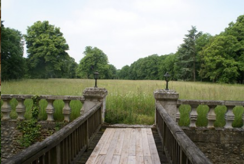
La vue sur le parc arboré