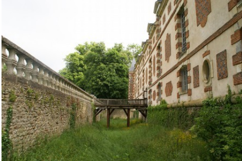
Les douves et la façade ouest